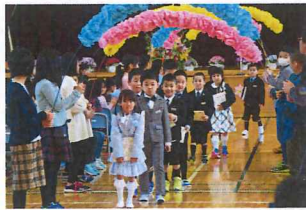
◆村教育委員会よりプレゼントされた絵本を手に、笑顔で退場する1年生

入学式では、校長式辞の中で「元気にあいさつや返事をする」「先生や友達の話は、目と耳で聞くこと」「自分でできることは自分ですること」の3つが大事な約束としてありました。