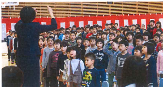
◆上級生がきれいな歌声で1年生を歓迎しました