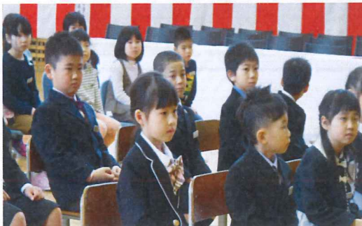
◆姿勢良く、しっかり話を聞くことができました

保護者の皆様と地域の皆様のご理解とご協力をこれまでと同様、よろしく願いいたします。